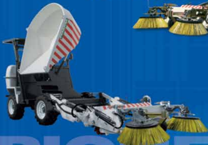
Barredora Hidrostática 4x4 BA-2500H-AG 4x4 Hydrostatic Sweeper